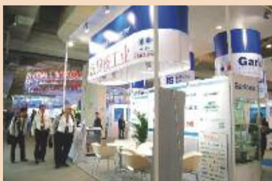
Vue partielle du Pavillon français organisé par le G.I.I.N. dans l'exposition NPI 2009 à Pékin.

Il est particulièrement actif dans les pays où le renouveau du nucléaire se concrétise par un programme de construction de nouveaux réacteurs : Chine, Etats-Unis, Inde, Royaume Uni, Afrique du Sud, Finlande...