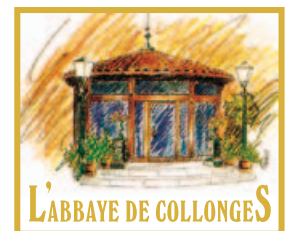
L'ABBAYE DE COLLONGES

La convivialité ne sera pas en reste durant ces Assises avec le Dîner de gala prévu dans la prestigieuse Abbaye de Collonges (Paul Bocuse) le 20 octobre au soir pour lancer cet événement dans des conditions agréables, propices aux premières discussions.